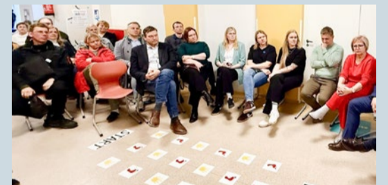
Обсуждения в Кохтла-Нымме.

Следующие встречи состоятся 21 апреля в Вокаском народном доме и 28 апреля в Ярвском центре услуг.