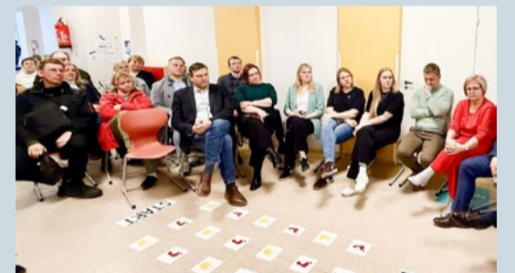
Kohtumine Kohtla-Nõmmel.

Järgmised kohtumised toimuvad 21. aprillil Voka rahvamajas ja 28. aprillil Järve teenuskeskuses.