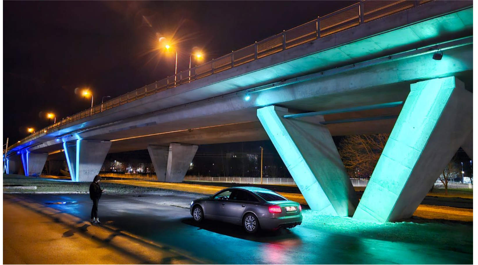
Õhtune viadukt.

Kuigi uus projekt hõlmab kogu viadukti dekoratiivvalgustust, on praegu välja ehitatud üks pool. „Hetkel on valgustatud ainult idapoolne külg. Kaasava eelarve ettepaneku tegija pakkuski