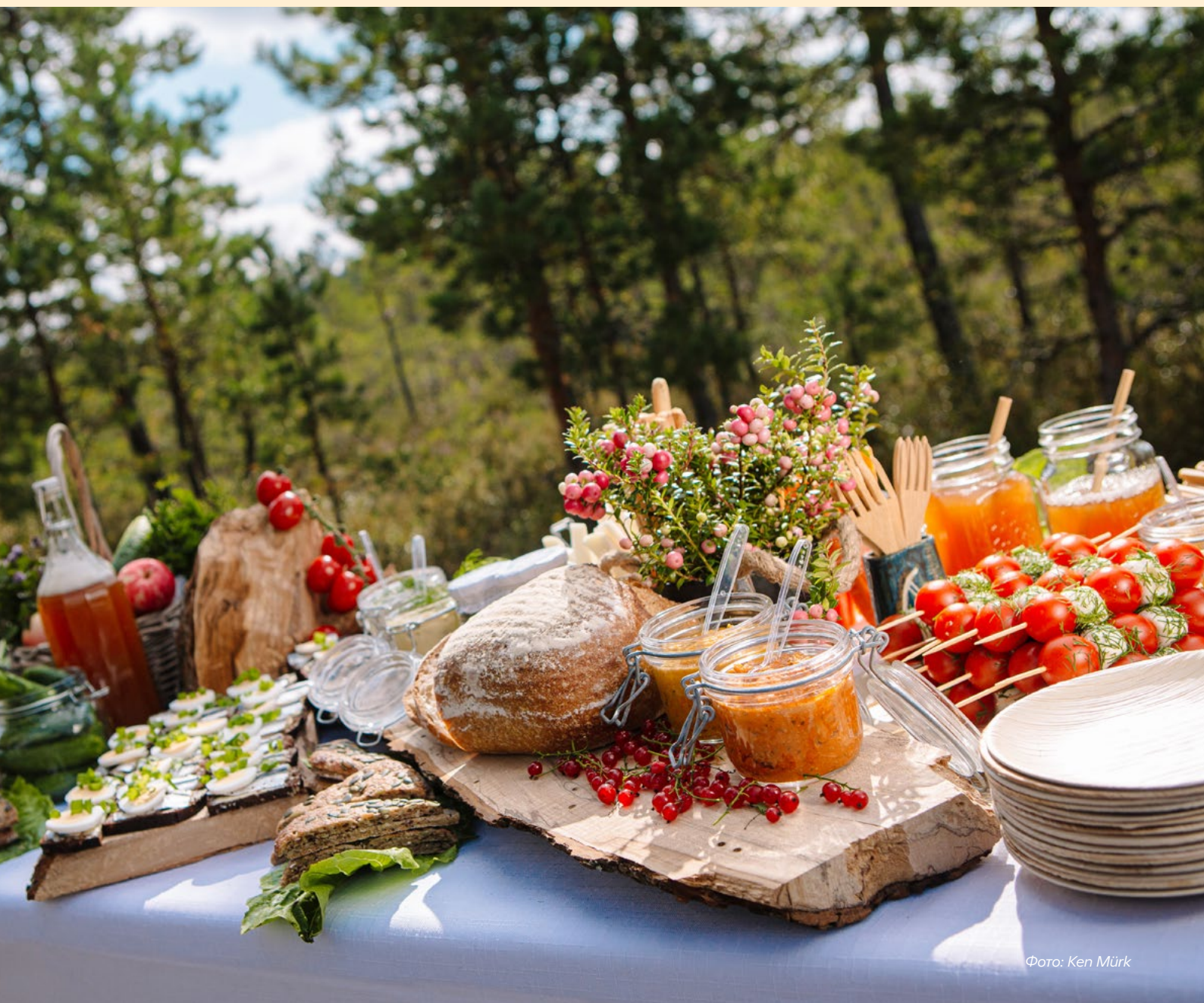
Фото: Ken Mürk