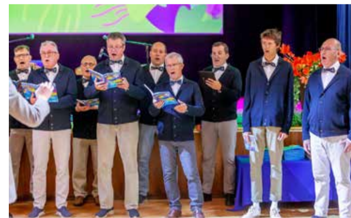
Tänuüritusel esines meeskoor Kaevur.

LEILA-EMILI MARTIN Jõhvi gümnaasiumi abiturient