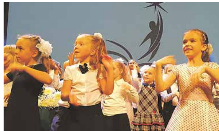
На торжественном акте в русской основной школе первоклашки танцевали на сцене шейк вместе с девятиклассниками.