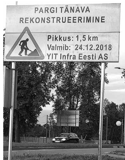
Улица Парги будет готова к Рождеству.

Ко второму октября подрядчик работ "Estamet OÜ" должен согласно договору закончить ремонт дворов и внутренних дорог квартирных товариществ. Работы выполнят в шести квартирных товариществах около домов по ул. Харидузе, 10, 12, 14 и 16, ул. Кааре, 31 и Нарвскому шоссе, 38. Эти работы обойдутся почти в 60000 евро, из них половину оплачивают квартирные товарищества и вторую половину покроят из волостного бюджета.