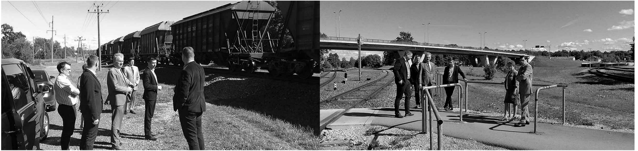
Вдобавок к кабинетным дискуссиям лично осмотрели места пересечения железной дороги.