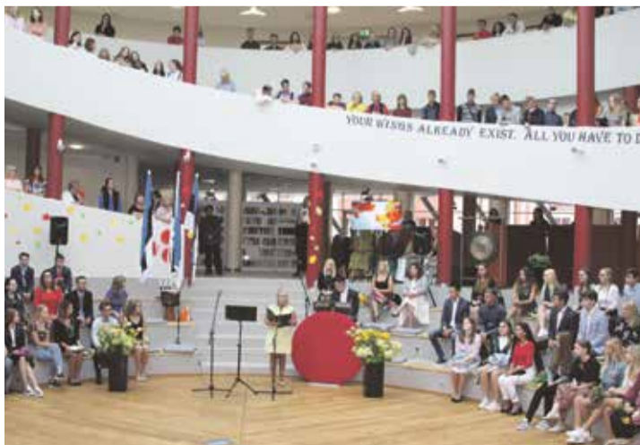
Гимназия едва вмещает всех учащихся.