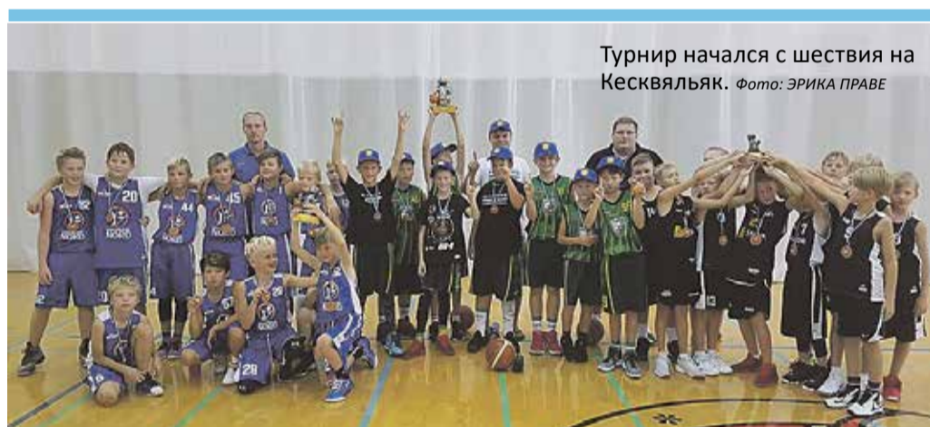
Турнир начался с шествия на Кесквяльяк.