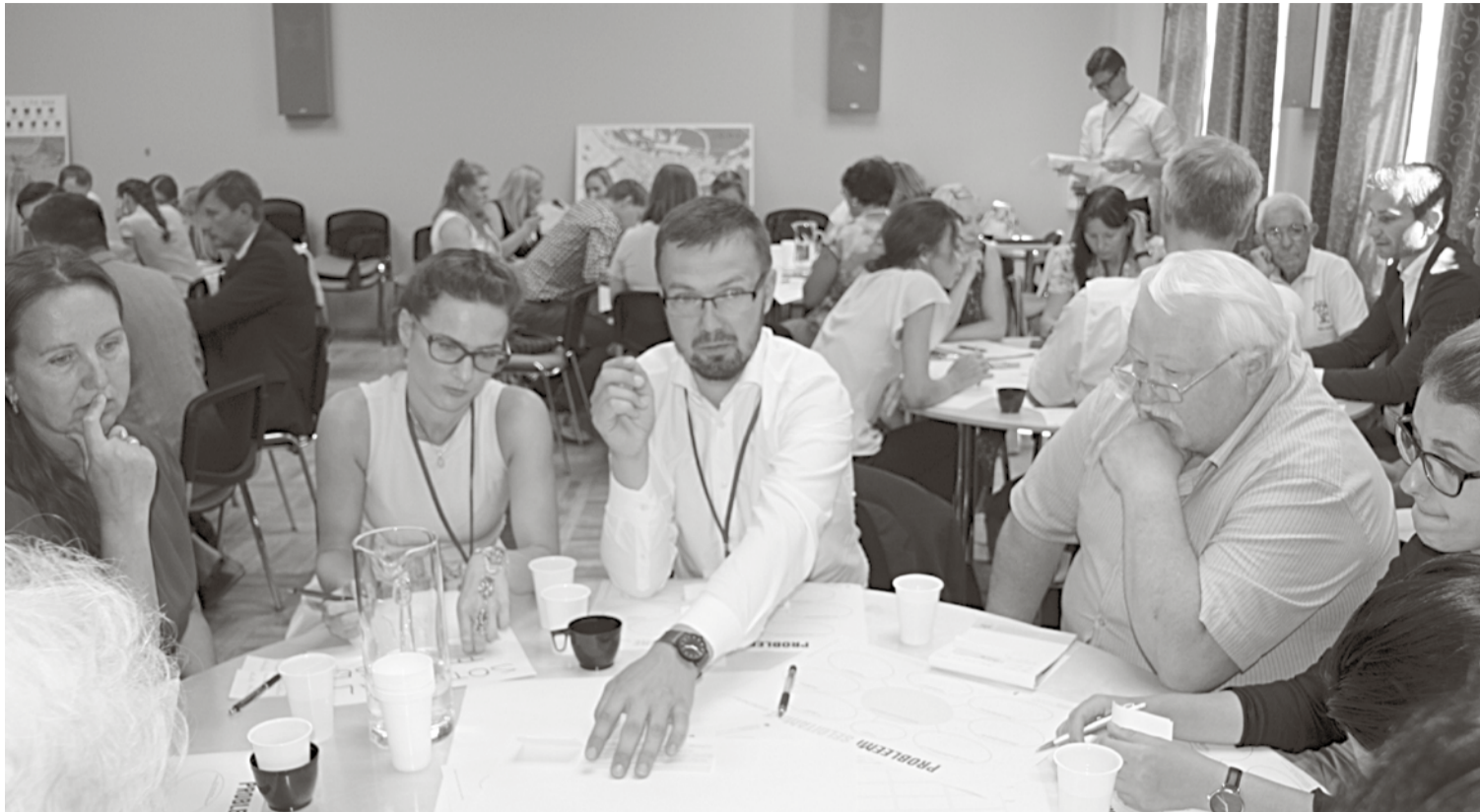
Во время выездной работы профильные группы обменялись мыслями и идеями.