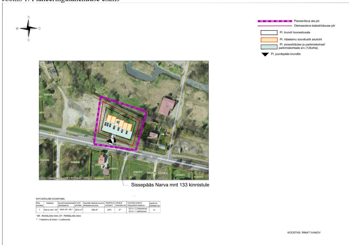
Joonis 1. Planeeringulahenduse eskiis