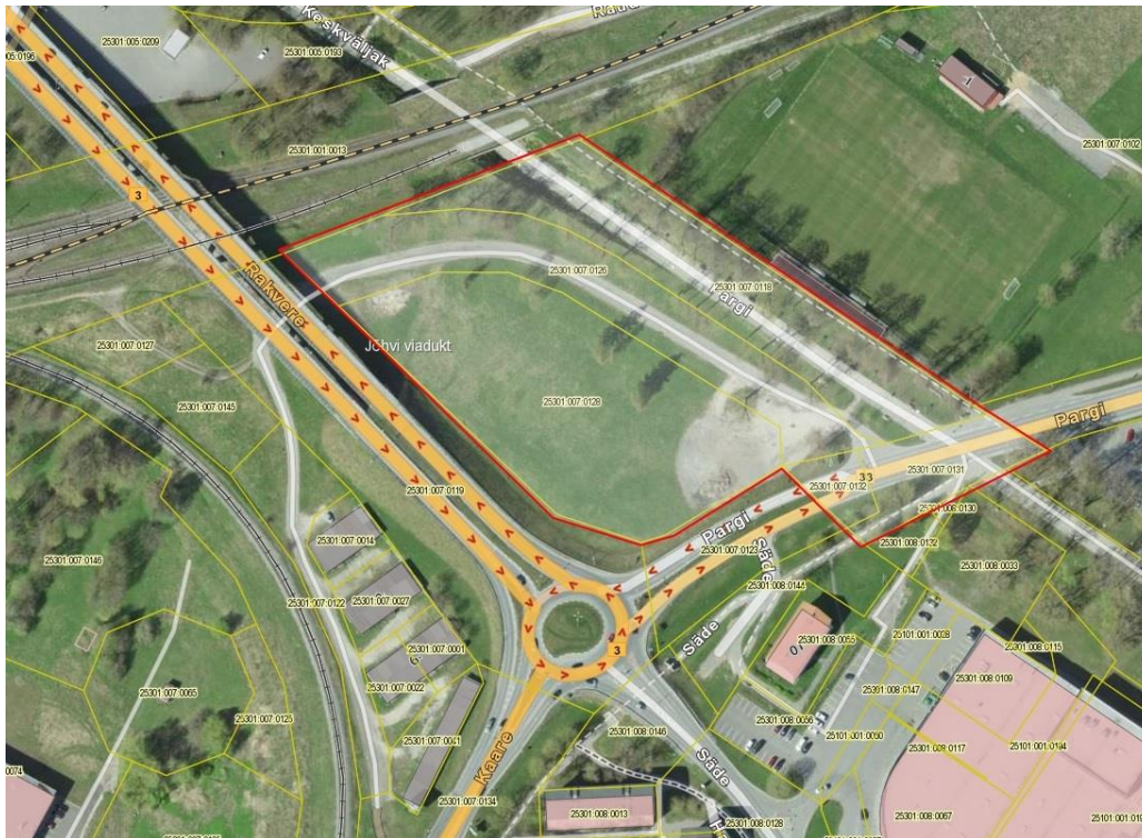
Planeeritava maa-ala skeem