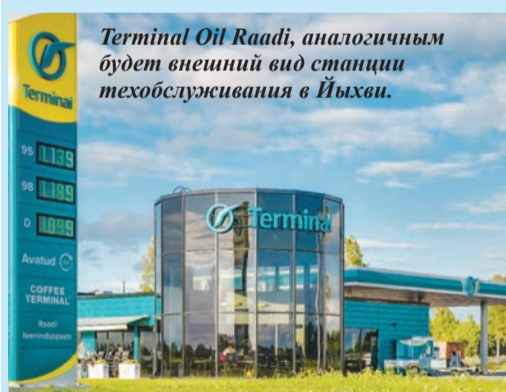
Terminal Oil Raadi, аналогичным будет внешний вид станции техобслуживания в Йыхви.

В январе волостная управа Йыхви провела встречу с правлением Terminal Oil Grupp, на которой предприниматели представили свой план строительства новой станции техобслуживания в Йыхви. Terminal Oil - Eesti Kütuserank приступит к строительству автозаправочной станции в непосредственной близости от центра Йыхви, Паркового центра, по адресу Puru tee 5b.