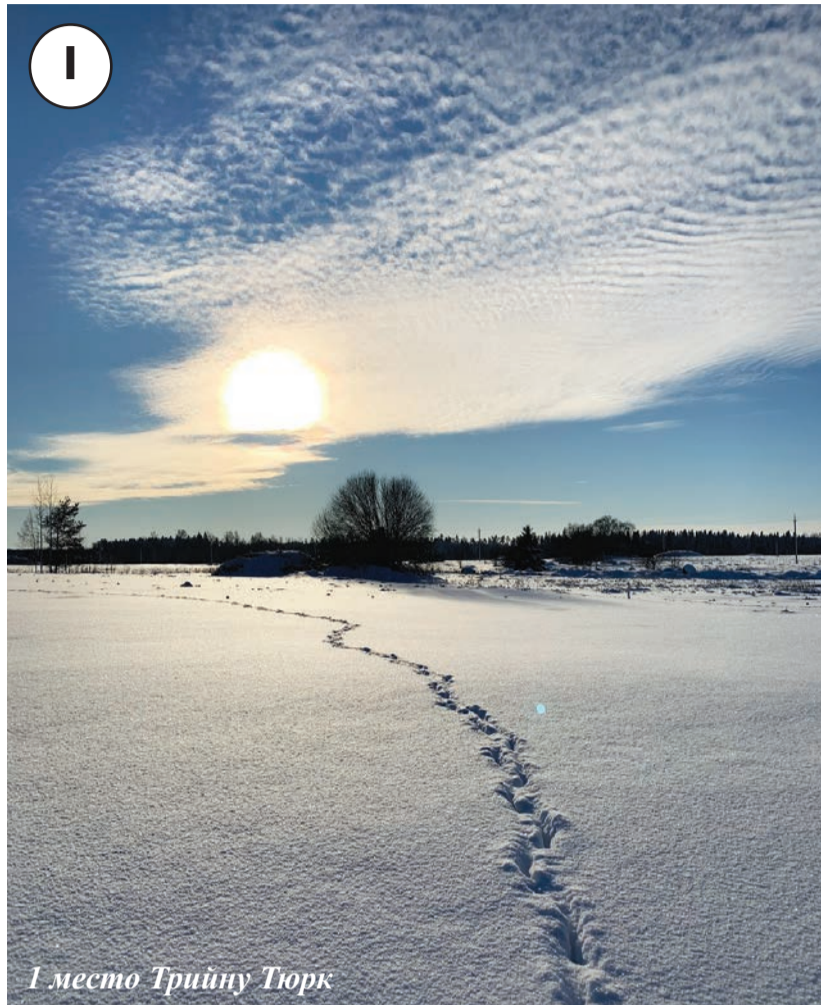
1 место Трийну Тюрк

В декабре прошла встреча с представителями Продовольственного банка, после которой впервые были выявлены нуждающиеся жители села под руководством сельского общества