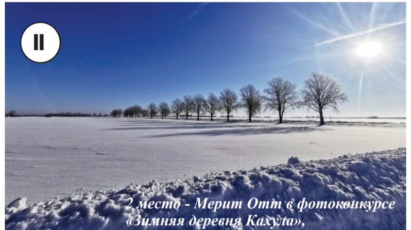
2 место - Мерит Отт в фотоконкурсе «Зимняя деревня Кахула»

самый главный праздник сельских жителей - День Святого Георгия - и показать, что эстонская деревня живет! С этой целью исторический центр Виттенштейн организует крупное общезстонское мероприятие - Ночные маяки Святого Георгия 2021. В рамках мероприятия, как правило, все жители Эстонии могут принять участие и зажечь общий Георгиевский огонь. Если из-за распространения коронавируса будет невозможно образовать огненную цепь и развести общий большой костер, то давайте зажжем костры в наших сельских дворах и будем вместе мысленно!