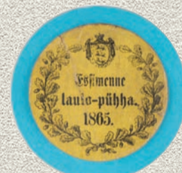
Знак в честь Йыхвиского певческого праздника

Главный концерт Певческого праздника прошел в церкви Михкли в Йыхви в пятницу, 2 июля 1865 года. Все исполнители Праздника песни также получили от Таллинского пастората специально заказанные красные, синие, желтые или зеленые значки. К счастью, до наших дней сохранилось два таких знака. На значке изображен герб эстонского воеводства и текст «Essimenne laulo-pühha, 1865».