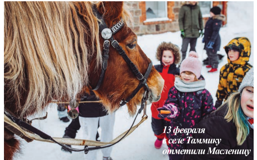
13 февраля в селе Таммику отметили Масленицу