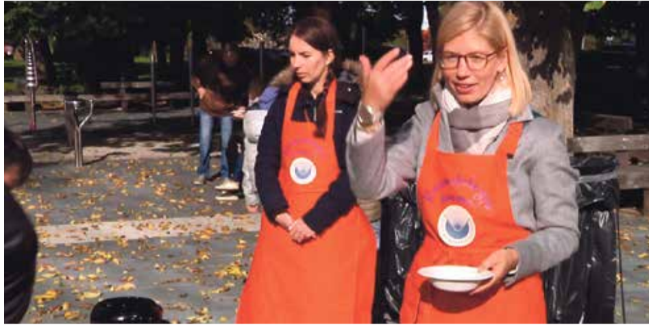
Министр на время присоединилась также к волонтерам, которые предлагали участникам дня общины утреннюю кашу и кофе.