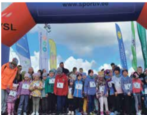
Старт малышоваго забега.