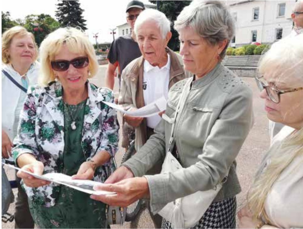
Состоялись исторические экскурсии по центру города.

Всего через три дня после провозглашения восстановления независимости Эстонии, 23 августа 1991 года, Верховный Совет Эстонской Республики отменил решение об объединении Йыхви с Кохтла-Ярве. Были восстановлены прежние названия улиц в городе и началось формирование Йыхвиского городского управления. После выборов в горсообрание в феврале 1992 года Президиум Верховного Совета Эстонской Республики своим указом от 17 июня 1992 года вернул Йыхви статус местного самоуправления. В июле 1992