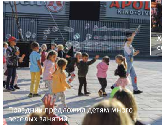
Праздник предложил детям много веселых занятий.

"Внимание! 1991! Старт!" - так называлась выставка Эстонского исторического музея, которая остановилась в июле на музыкальной площадке и предлагала желающим ретроспективный взгляд на девяностые годы, а также пищу для размышлений и дискуссий о прошлом и будущем. В рамках этой выставки под руководством Общества Йыхвиского музея также прошел отличный исторический день, главным акцентом которого была экскурсия в "историю восстановления независимости" Йыхви - его отделение от Кохтла-Ярве в тот же период 1991-1992 гг.