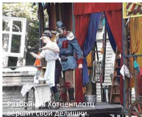
Разбойник Хотценплотц вершит свои делишки.