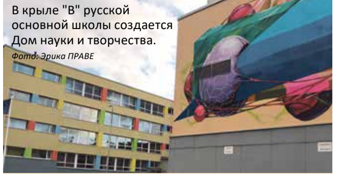
В крыле "В" русской основной школы создается Дом науки и творчества.