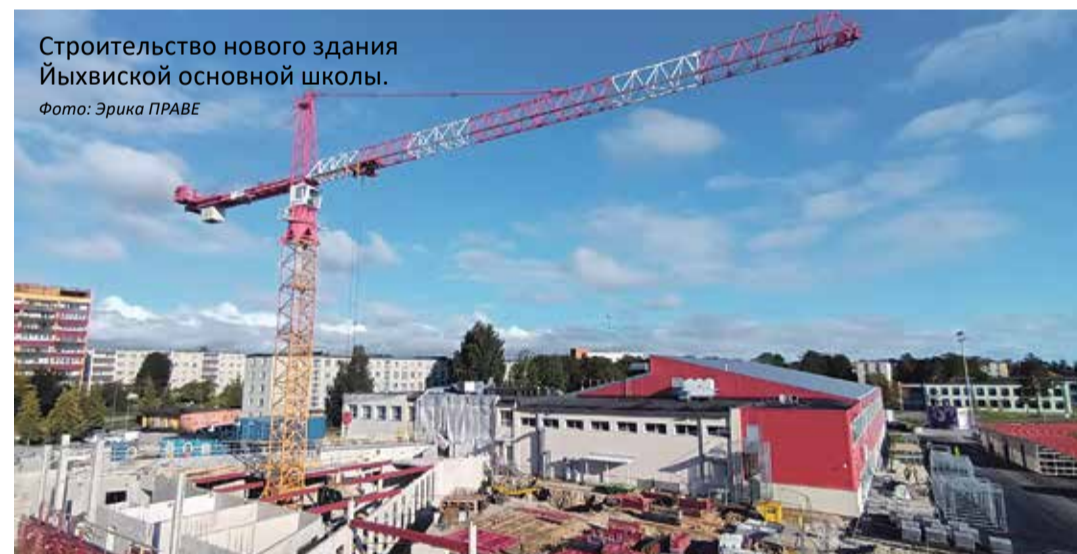
Строительство нового здания Йыхвической основной школы.

В 2019 году началась реконструкция стадиона Йыхвической русской основной школы, и работы были завершены в 2020 году, волость выделила на этот проект 710,6 тысячи евро.