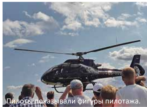
Пилоты показывали фигуры пилотажа.