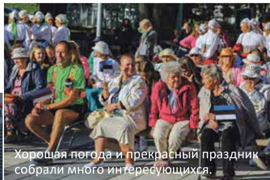
Хорошая погода и прекрасный праздник собрали много интересующихся.

Нельзя не упомянуть сюрприз нынешнего лета - Йыхвский день авиации, который после длительного перерыва вновь вернул аэродром к жизни и который, судя по историческим документам, был ничуть не хуже состоявшегося в 1933 году. В этот день предлагались различные мероприятия для всей семьи. Прибывшие на место легкомоторные самолеты можно было исследовать