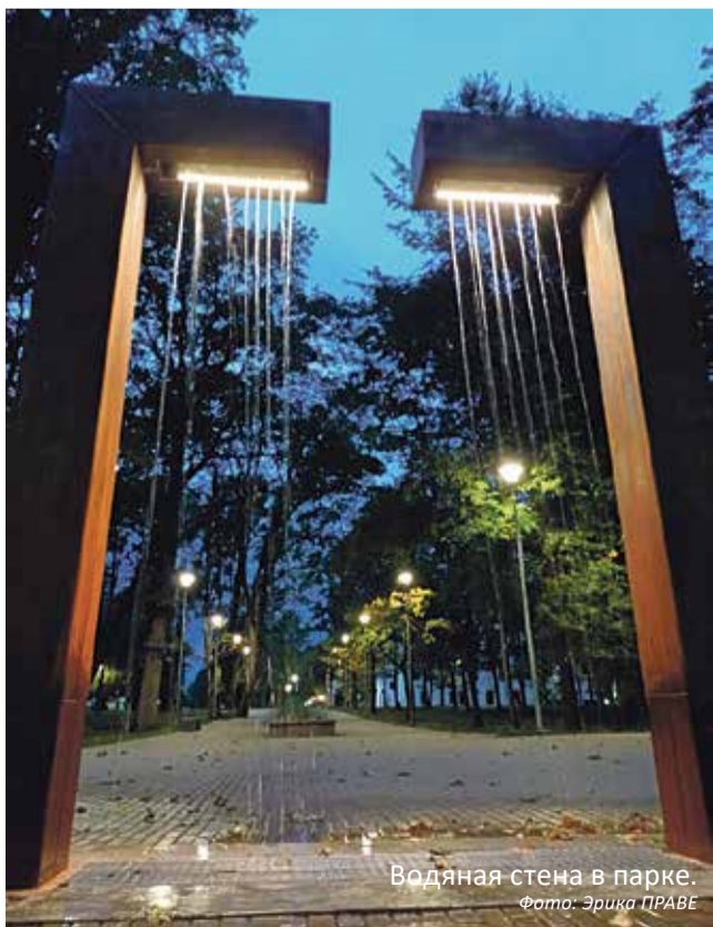
Водяная стена в парке.

- В парке установлено 42 светильника и заасфальтировано 3500 квадратных метров дорог, - подытожил сделанные работы Антон Нестеров, специалист волостной управы по строительству и проектированию. По его словам, в рамках работ в парке также была установлена водяная стена, а на ее площадке уложена брусчатка. Брусчатку уложили также перед певческой сценой.