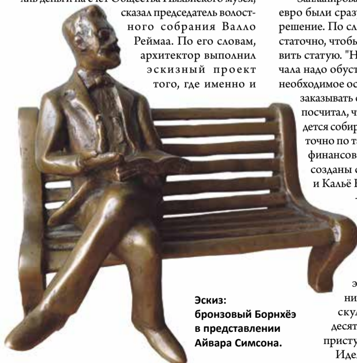
Эскиз: бронзовый Борнхёэ в представлении Айвара Симсона.