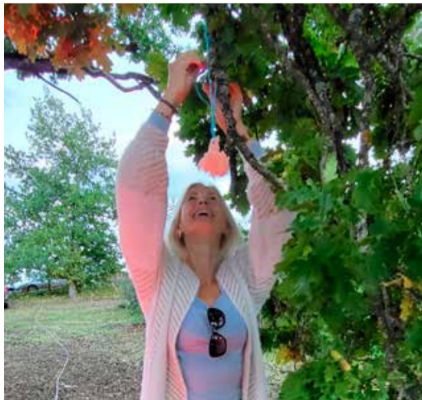
Фото: Эрика ПРАВЕ

Осень поприветствовали концертом в день солнцестояния в Таммикской священной роще, где присутствующие загадывали желания и привязывали ленточки к ветвям или стволам древних дубов. Фото: Эрика ПРАВЕ