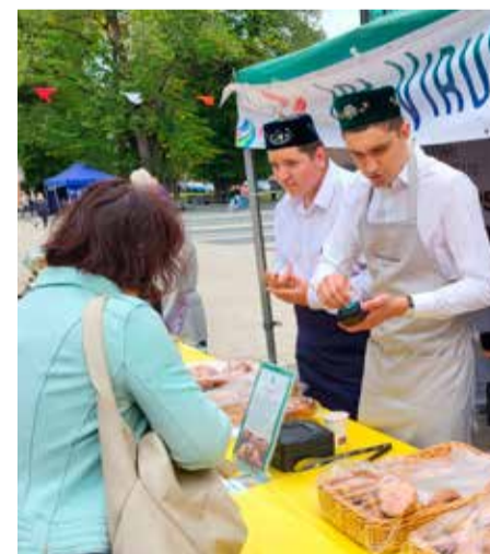
На фестивале "Творческий котел" можно было попробовать блюда разных национальных кухонь; на снимке предлагают деликатесы члены татарского общества.

- "Творческий котел" дает разным культурным обществам возможность показать себя и свое наследие, это также означает, что темами культуры все же занимаются, - отметила Уттендорф и констатировала, что есть общества, состав которых состарился и сократился, но есть те, кто способен передать национальные традиции своим детям и внукам и отвести им определенную роль в деятельности общества.