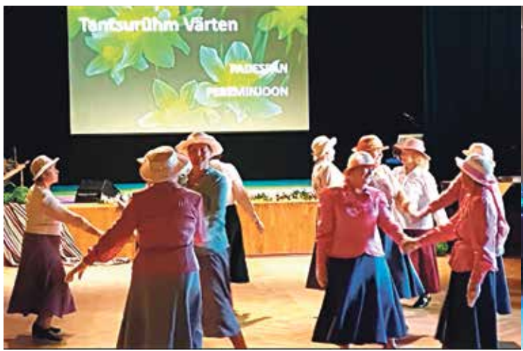
Танцевальный ансамбль "Värten" отметил 25-й юбилей в Таммикусском народном доме.