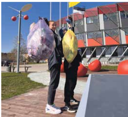
"Улов" гимназистов в день уборки рядом с гимназией и в парке.