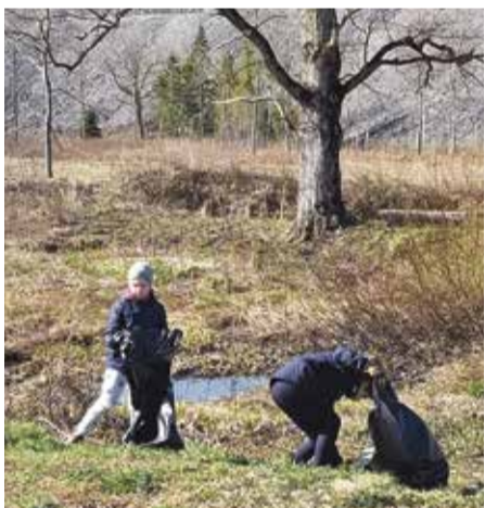
Основная школа убиралась в окрестностях священной дубравы.