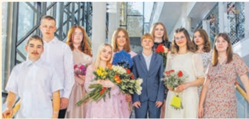
64-й выпуск Йыхвиской музыкальной школы.