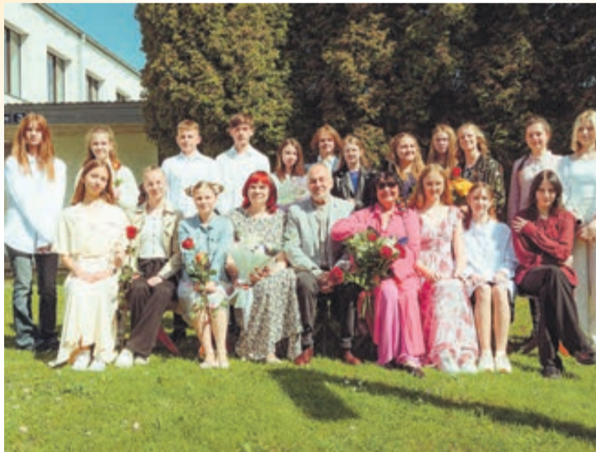
Выпускники художественной школы 2023 года.