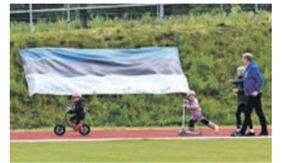
По стадионному кругу шагали люди всех возрастов.