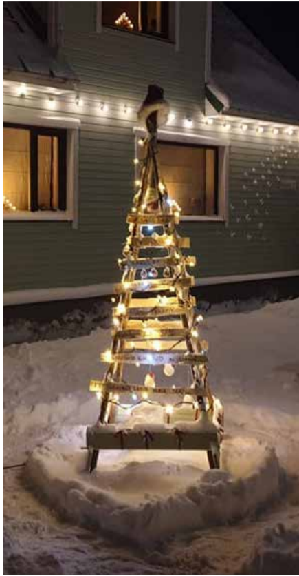
Прошлогоднее песенное рождественское дерево.