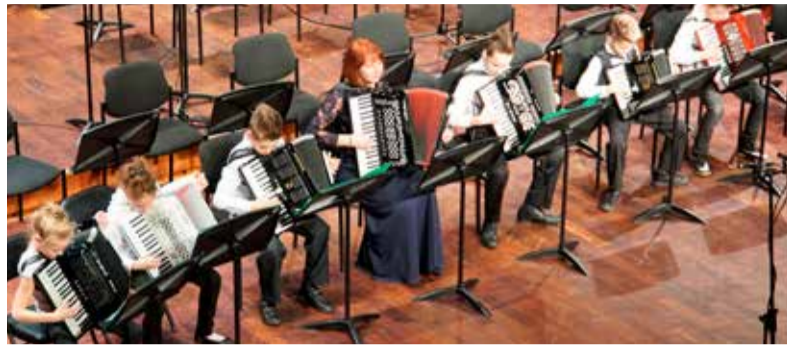
Выступают юные ученики музыкальной школы.

В музыкальной школе всегда проводились вступительные экзамены,