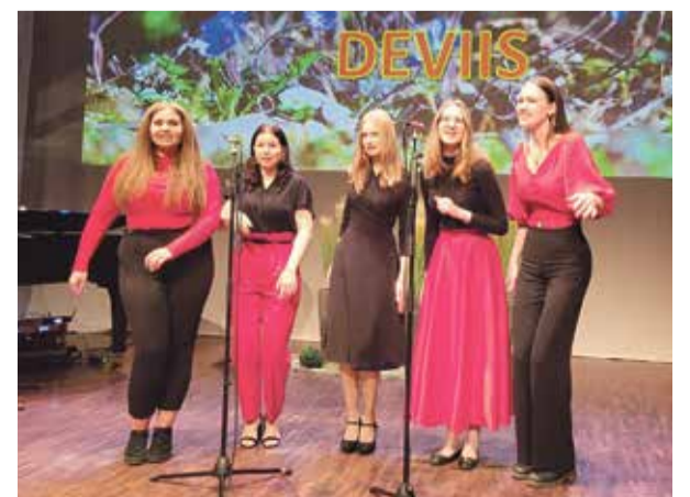
Гран-при увезли пыльваские девушки из ансамбля "DeViis".