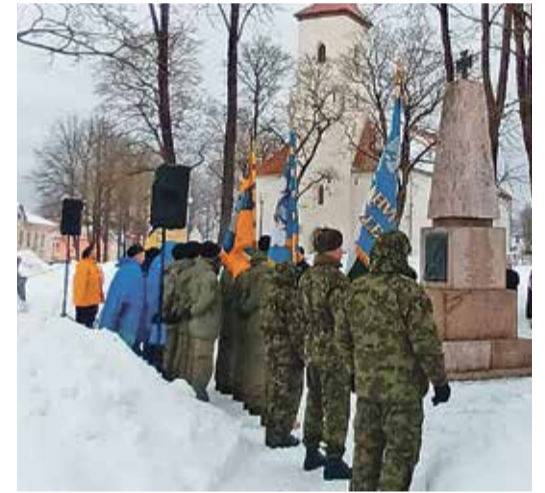
Церемония празднования Дня независимости у памятника павшим в Освободительной войне.