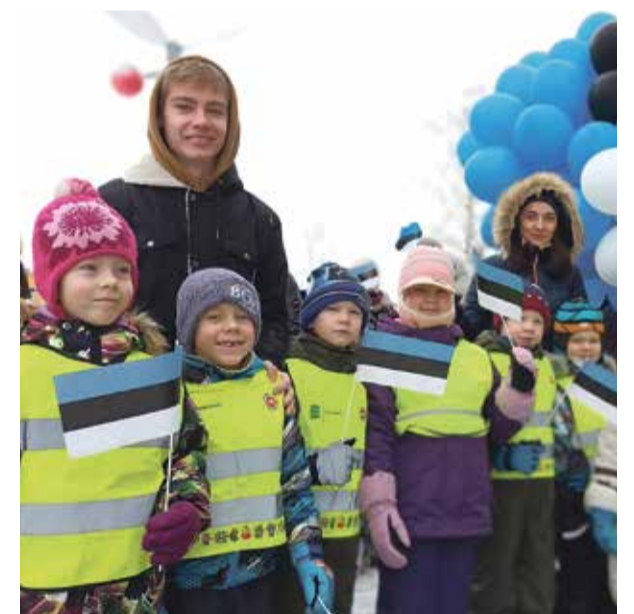
Гости из детского сада "Kalevipoeg".