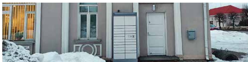
Пользование книжным шкафом бесплатно.

Литературу можно резервировать и заказать в шкаф на сайте www.lugeja.ee . "Это читательский портал, где можно также самостоятельно продлить срок, встать в очередь, просмотреть свои бронировки и взятые на дом издания, а также зарегистрироваться в качестве пользователя библиотеки, - пояснила Линнарда. - Конечно, сделать заказ можно также по телефону или электронной почте, но в самообслуживании все эти действия делать удобнее".