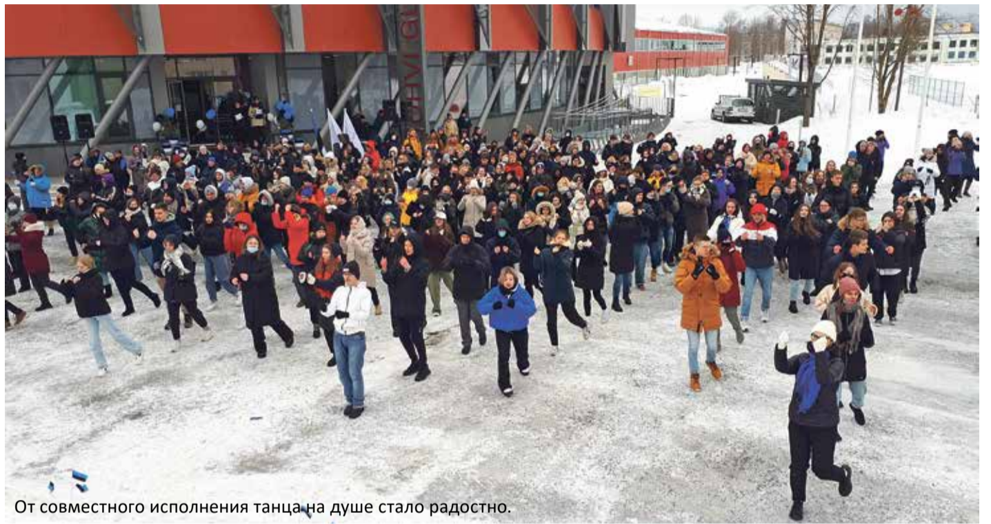
От совместного исполнения танца на душе стало радостно.