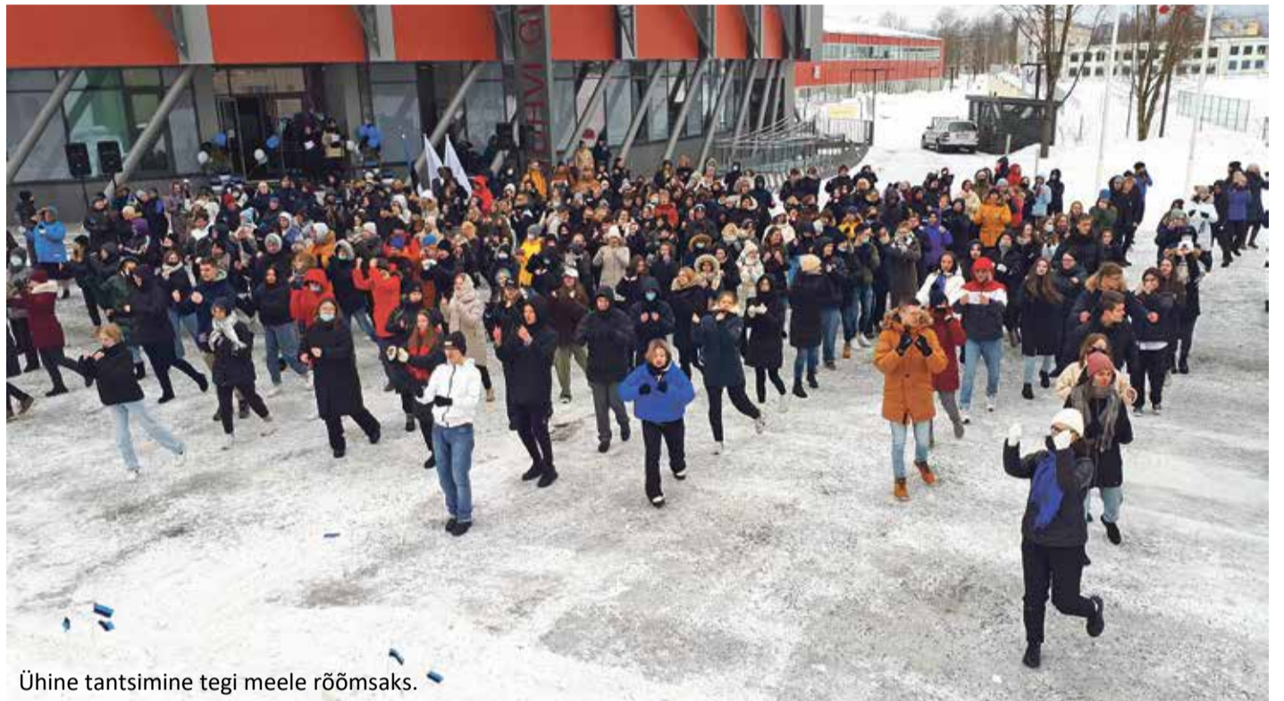
Ühine tantsimine tegi meele rõõmsaks.