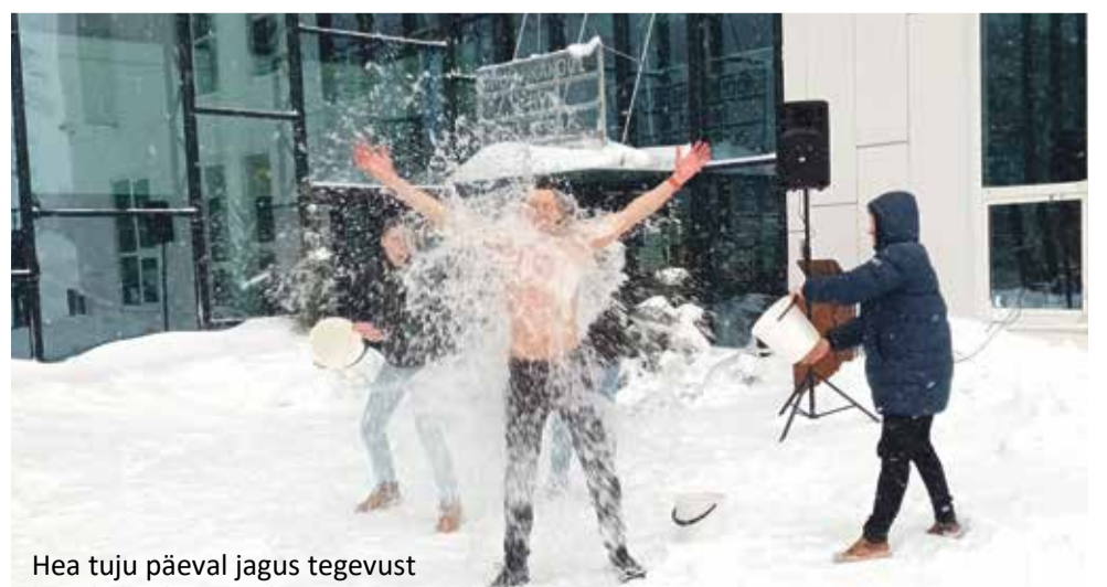
Hea tuju päeval jagus tegevust liuväljal ja kontserdimaja ees.