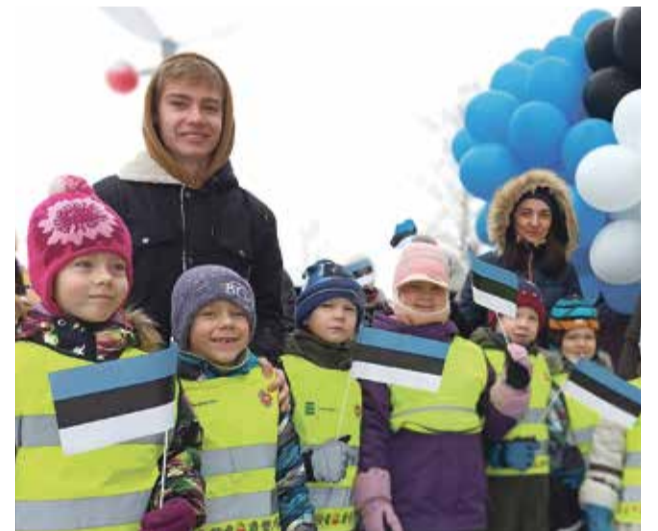
Külalised Kalevipoja lasteaiast.