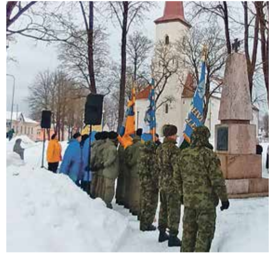
Iseseisvuspäeva tseremoonia Vabadussõja ausamba juures.